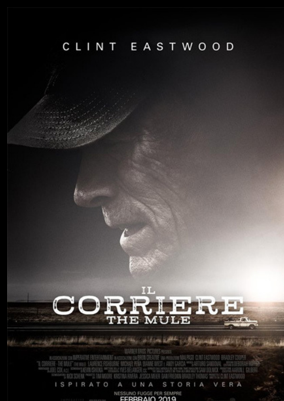
IL CORRIERE - THE MULE GIO 20, VEN 21 giugno

in caso di maltempo le proiezioni saranno recuperate il giorno successivo, ad eccezione di GREEN BOOK