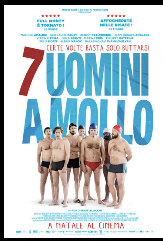
7 UOMINI A MOLLO LUN 1, MAR 2 luglio