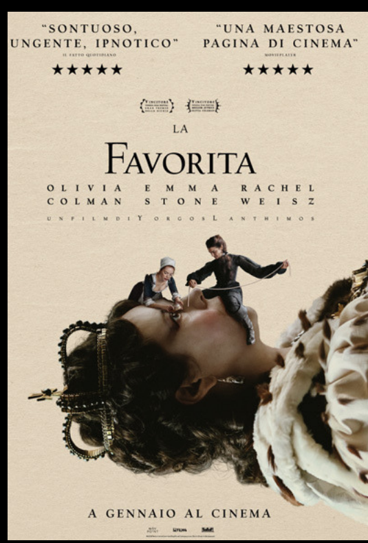
LA FAVORITA GIO 27, VEN 28 giugno