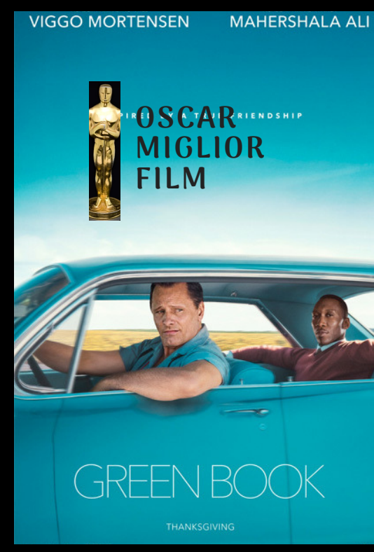
GREEN BOOK GIOVEDI' 4 luglio