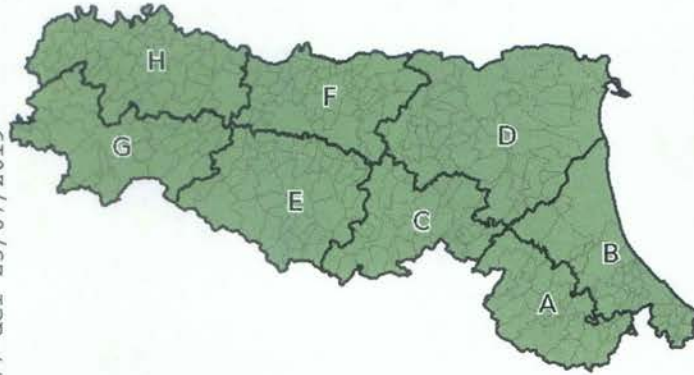
Criticità meteo e marino-costiera